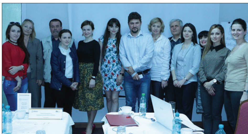
Участники учебного курса «Правильный подход к тематике ЕС – правила, принципы, стандарты» (29-30 мая), организованного Центром независимой журналистики (ЦНЖ) при поддержке Агентства США по международному развитию (USAID) в рамках проекта «Партнерства для Устойчивого гражданского общества в Молдове», осуществляемого FHI 360.