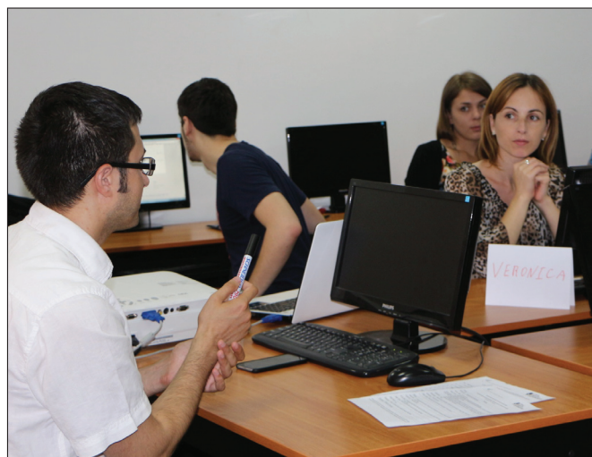
На фотографии – Тренинг организован в рамках проекта «Борьба с ненавистной речью в медиа-онлайн и социальных сетях», осуществляется ЦНЖ при финансовой поддержке партнерской организации «Civil Rights Defenders», Швеция.

Сфера правосудия также расставляет акценты, которые следует принимать во внимание. Можно привести примеры исков, рассмотренных судебными инстанциями, а также несколько интересных решений, вынесенных Советом по предупреждению и ликвидации дискриминации и обеспечению равенства.