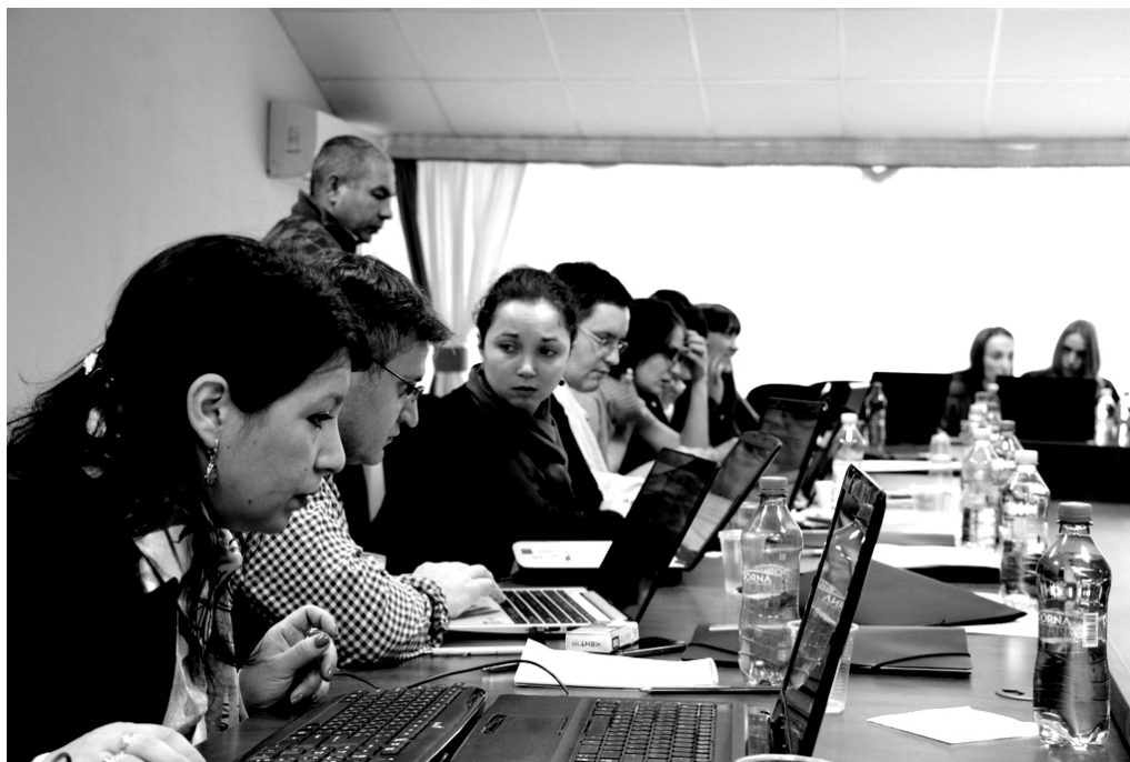
Эксперты румынской организации «RISE Project» объясняют журналистам способы обнаружения открытых данных в интернет-ресурсах на одном из тренингов, организованных ЦНЖ на тему дата-журналистики. Кишинев, октябрь 2013 г.

несовершеннолетних, прежде всего, в местах, доступных для них, будь то школа или библиотека;