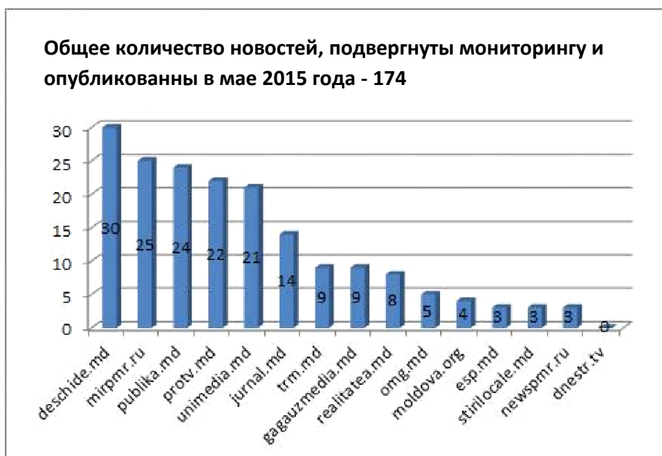
Диаграмма 1. Общее количество новостей, опубликованных в мае 2015 года на подвергнутых мониторингу сайтах

Большое количество новостей объясняется также тем, что во время мониторинга имело место другое значимое для прессы событие - высылка из Республики Молдова румынского гражданина Георгия Симиона. Новости, героем которых стал Георгий Симион, относятся к политико-этнической тематике. Тем не менее, они также были подвергнуты мониторингу, так как этнические группы являются предметом настоящего отчета.