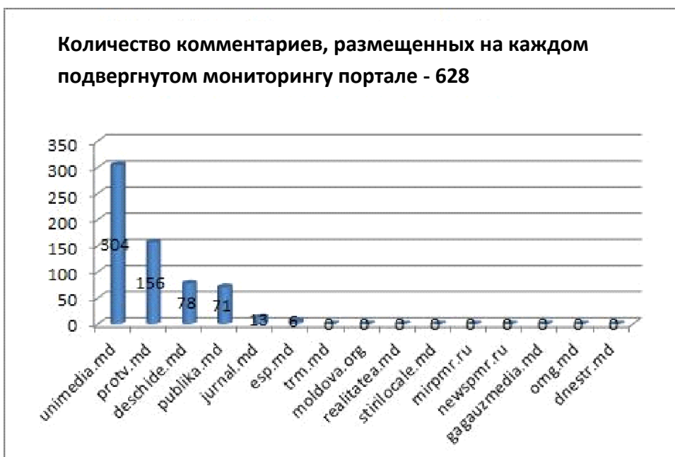
Диаграмма 3. Количество комментариев, размещенных на каждом подвергнутом мониторингу портале

«trm.md» - в период мониторинга на сайте «trm.md» было опубликовано 9 сюжетов, касающихся групп, подвергнутых мониторингу: три из них относятся к этническим меньшинствам, три – к сексуальным меньшинствам и три посвящены заключенным, ВИЧ-инфицированным и лицам с ограниченными возможностями. Журналисты представили сюжет новостей коротко, используя соответствующий норме язык, исключая использование стереотипов или опорочивающих терминов. Ни один пользователь не оставил комментарий к новостям, опубликованным на сайте.